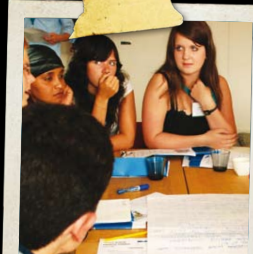
Global Competition and Climate Changes Hakija: Norrbottenin Norden-yhdistys, Ruotsi

Latvian Kuldiga Culture Center järjesti seminaarin, johon kokoontui taiteista kiinnostuneita nuoria Islannista, Latviasta, Liettuaista, Ruotsista, Tanskasta, Venäjältä ja Virossa. Osallistujat saivat mahdollisuuden edistää yhteispohjoismaisen kulttuurin ymmärtämistä. Lisäksi tavoitteena oli saada lisää nuoria kiinnostumaan taiteesta, kulttuurista ja yhteispohjoismaisesta perinnöstä. Tapahtuma järjestettiin Latviassa 30.11.–2.12.2007.