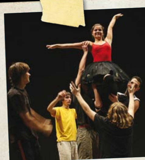
Ice and Fire at Heritage Sites Hakija: Kuldiga Culture Center, Latvia

Helsingin Keskustanuoret järjestivät vuoden 2008 huhtikuussa seminaarin, jossa käsiteltiin väestönkehityksen haasteita Euroopassa ja Pohjoismaissa. Merkitseekö väestönkehityksen nykysuuntaus etnisten vähemmistöjen aseman paranemista? Miten maahanmuuttajien pitäisi suhtautua uuden kotimaansa kieleen ja työkuulttuuriin? Osallistujat keskustelivat seminaarissa muun muassa työmarkkinoihin liittyvistä teoreettisista kysymyksistä. Seminaariin saapui osallistujia Islannista, Luoteis-Venäjältä, Ruotsista, Suomesta, Tanskasta ja Virosta.