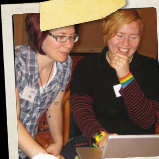
Students for Transgender Inclusion Hakija: Association of Nordic LGBTQ Student Organization (ANSO), Tanska

Norrbottenin läänin Norden-yhdistys järjesti Haaparannassa Ruotsissa konferenssin, jonka aiheena oli globaali kilpailu ja ilmastomuutos. Konferenssissa keskusteltiin siitä, miten globalisaatio vaikuttaa Pohjoiskalotin alueeseen ja miten Pohjoismaiden alueyhteistyö voi luoda edellytykset kilpailukykyiselle ja ympäristötietoiselle Pohjolalle.