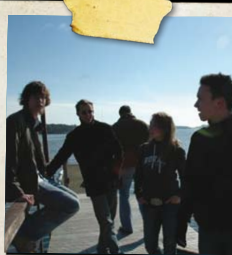
Young Foreigners in Aging Europe Hakija: Helsingin Keskustanuoret, Suomi

Helsingin Keskustanuoret järjestivät vuoden 2008 huhtikuussa seminaarin, jossa käsiteltiin väestönkehityksen haasteita Euroopassa ja Pohjoismaissa. Merkitseekö väestönkehityksen nykysuuntaus etnisten vähemmistöjen aseman paranemista? Miten maahanmuuttajien pitäisi suhtautua uuden kotimaansa kieleen ja työkuulttuuriin? Osallistujat keskustelivat seminaarissa muun muassa työmarkkinoihin liittyvistä teoreettisista kysymyksistä. Seminaariin saapui osallistujia Islannista, Luoteis-Venäjältä, Ruotsista, Suomesta, Tanskasta ja Virosta.