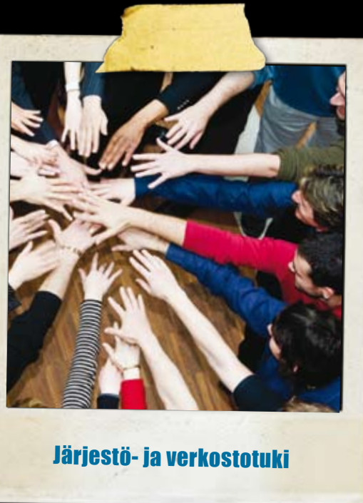
Järjestö- ja verkostotuki

Pohjoismaissa toimivat järjestöt voivat myös hakea tukea omaan pohjoismaiseen toimintaansa. Tukea myönnetään pohjoismaisille verkostoille, joissa on osallistujia vähintään kolmesta Pohjoismaasta tai itsehallintoalueelta eli Ahvenanmaalta, Färsearilta, Grönlannista, Islannista, Norjasta, Ruotsista, Suomesta tai Tanskasta. Pohjoismaiden ministerineuvosto myöntää järjestö- ja verkostotukea yhteensä noin miljoona Tanskan kruunua vuodessa. Vuonna 2008 yhteensä 19 pohjoismaista järjestöä sai apurahaa pohjoismaiseen yhteistyöhön.